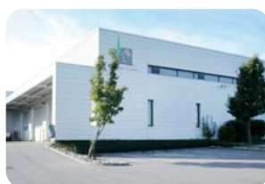
Site Vallée des Vignes

5-7 rue Pierre Rollin 80092 AMIENS CEDEX 3 Tél. : 03 60 12 34 97 Fax : 03 60 12 34 99 Courriel : contact@epsoms80.fr