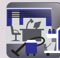
Entretien des locaux