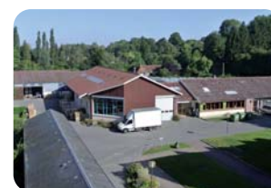
Site Nicolas Roussel

Avenue d'Allemagne 80090 AMIENS Tél. : 03 60 12 34 97 Fax : 03 60 12 34 50 Courriel : contact@epsoms80.fr