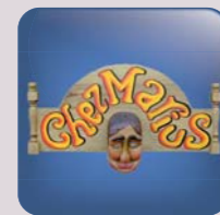
Estaminet & jeux Picards