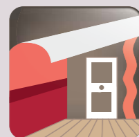
Peinture & décoration